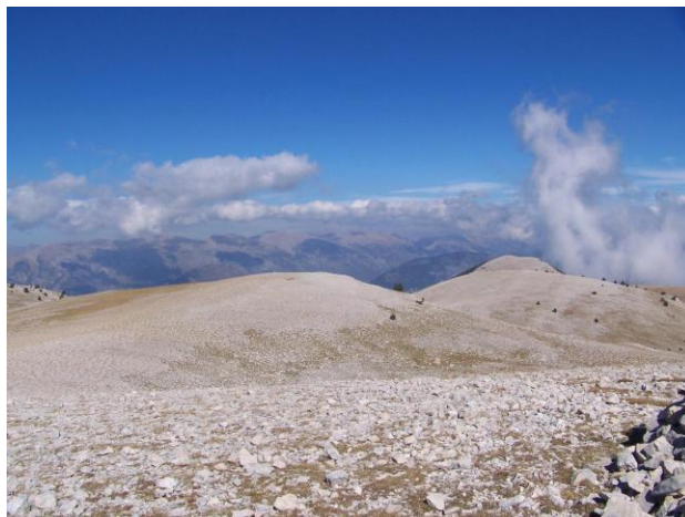
Panorama des del Pedró dels Quatre Batlles