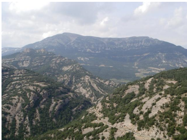
Port del Compte des del Santuari del Lord