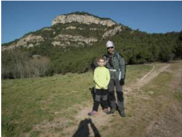
Cingle de Sant Sadurní