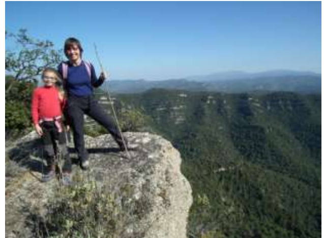
Panorama des del Serrat Punxerut