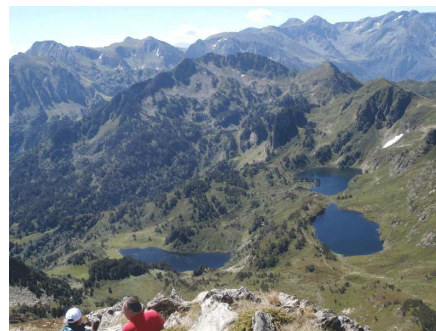
Vista dels llacs