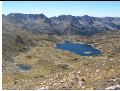
Estany de l'Illa de camí a Pessons

Descripció de la zona: la Vall de Madriu és una de les valls més llargues i poc concorregudes d'Andorra. Està situada a llevant de la capital del Principat i està envoltada de cims notables com el Pic de Pessons al nord-est i la Tossa Plana de Lles al sud-est.