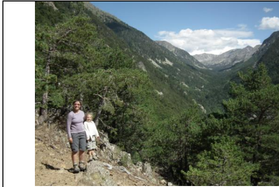
Panoràmica de la Vall de Madriu